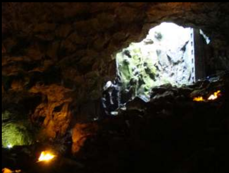
Furna do Enxofre — Graciosa

O ano termina com a publicação de mais uma carta de geossítios e com o pensamento focado nos desafios e objectivos que se propõem para 2011, sendo o mais importante a entrega do dossier de candidatura às Redes Europeia e Global de Geoparques, no mês de Outubro.