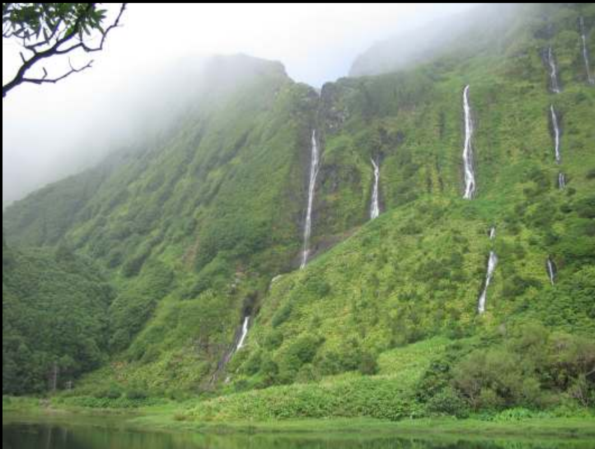
Poço da Alagoinha – Flores